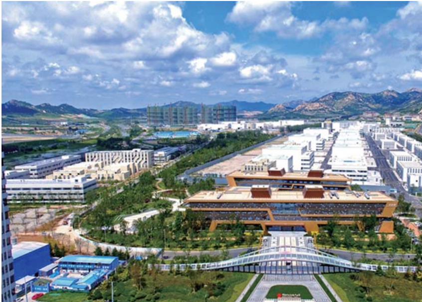
灵山湾影视产业园全景。

世博城项目总投资500亿元,总占地3000亩,于2015年11月正式开工建设。项目以会议展览产业和旅游为引擎,列入山东省海洋经济新旧动能转换重大项目库和青岛市重点项目,建有总建筑面积64万平方米的国际会议中心、国际展览中心、会展商务配套中心及交通物流中心。建成后,将成为东北亚区域规模最大、配套最完善、科技水平最高、绿色节能环保的滨海博览城。