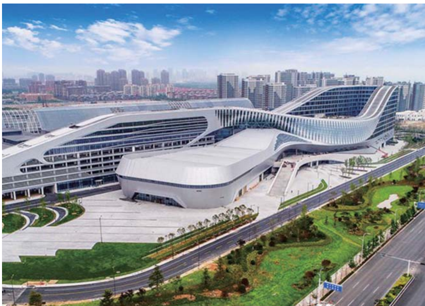
西海岸新区中铁博览城。

英国塔苏斯大中国区总裁马克在考察了世博城建设情况后盛赞道:“青岛世博城从规划设计到施工建设都很高端,可以媲美米兰世博主展馆。”