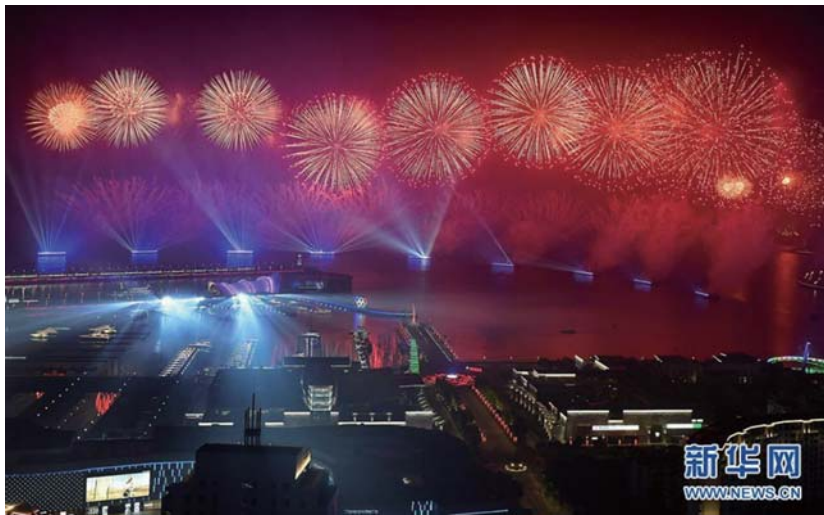
这是青岛举行的《有朋自远方来》灯光焰火艺术表演(6月9日摄)。

吉尔吉斯斯坦比什凯克、塔吉克斯坦杜尚别、俄罗斯乌法、乌兹别克斯坦塔什干、哈萨克斯坦阿斯塔纳……5年来,习